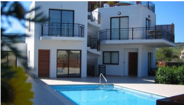
Prodromi Pool Area