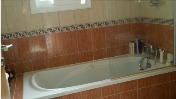
Kathikas Villa Bathroom