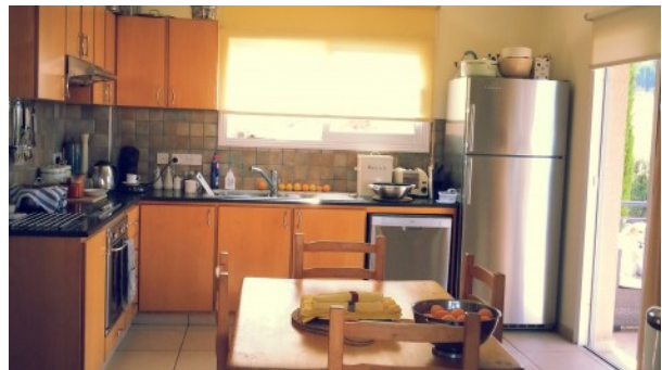
Kathikas Villa Kitchen