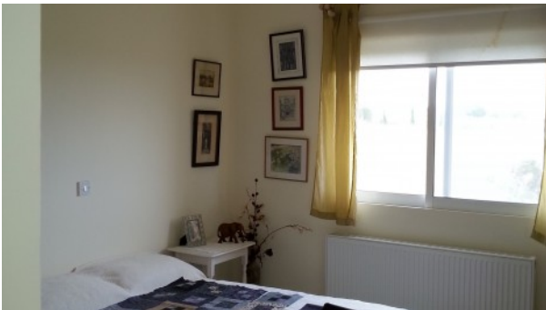
Kathikas Villa Zweites Schlafzimmer