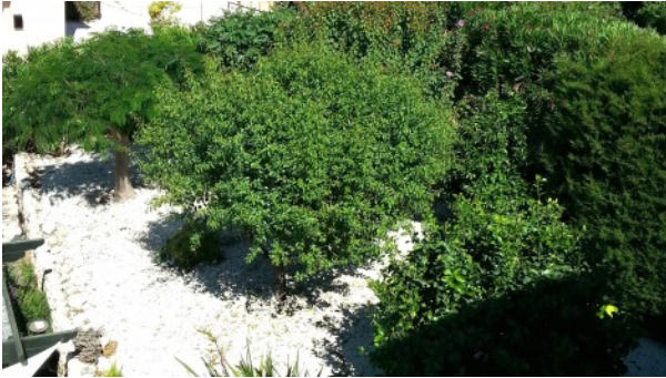
Kathikas Villa Top Garden