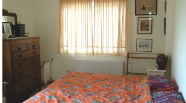
Kathikas Villa Drittes Schlafzimmer