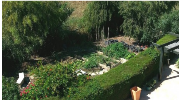
Kathikas Villa Gemüsegarten