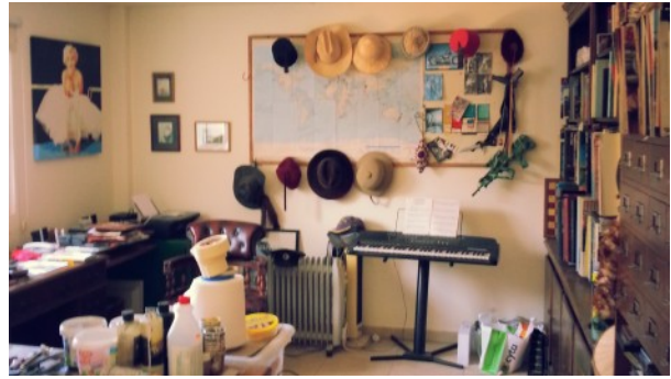
Kathikas Villa Studio