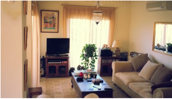
Kathikas Villa Lounge