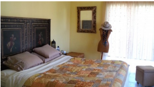
Kathikas Villa Master Bedroom