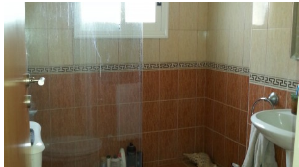
Kathikas Villa On suite Badezimmer mit Dusche