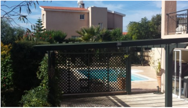
Kathikas Villa Garage