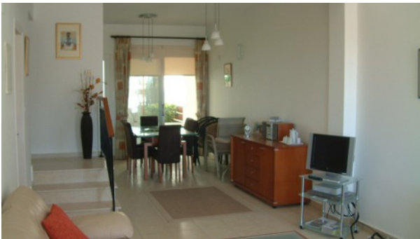
Despina 11 Wohn-und Esszimmer