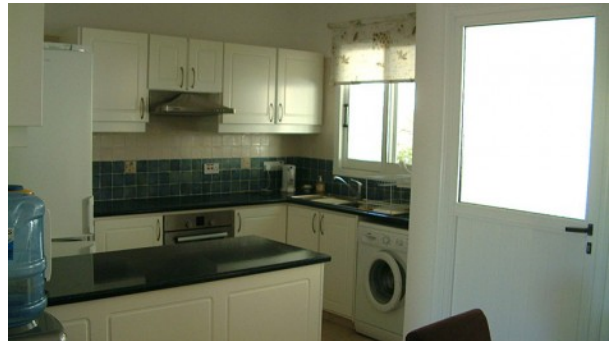
Despina 11 Küche