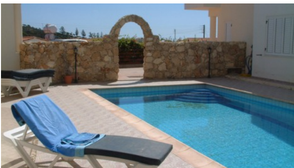
Despina 11 Swimmingpool