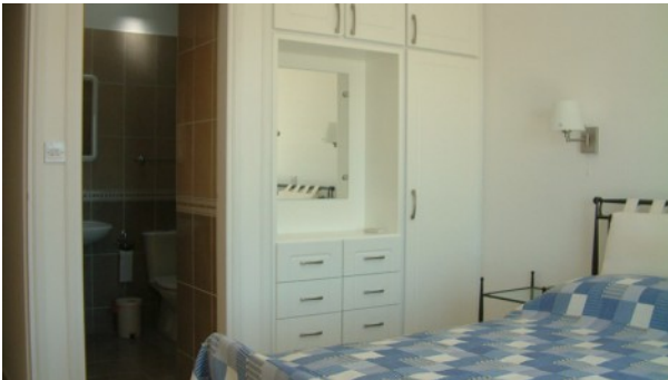
Despina 11 Schlafzimmer